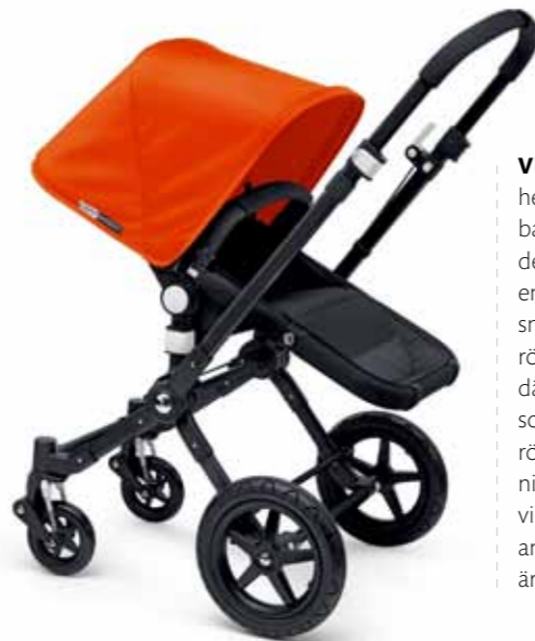
BUGABOO BARNVAGNEN ÄR GJORD FÖR ATT DET ALLTID SKA VARA LÄTT ATT TA SIG FRAM ÄN VAR DU BOR. DEN ÄR ÄVEN SMIDIG ATT FÄLLA IHOP OCH TA MED SIG.

Vi har precis fått vårt första barn och tycker att det är svårt att lyckas ställa undan vagnen i förrådet eftersom jag ofta är ensam med barnet. Varför får vi inte förvara vår barnvagn i trapphuset eller utanför dörren, det är ju där vi behöver den?