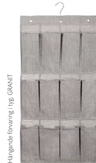
Hängande förvaring i tyg, GRANIT

Nu är det dags att plocka bort sommarkläder och istället ta fram det du behöver för höst och vinter. På samma gång kan du passa på att rensa och optimera dina garderobsutrymmen för att få mera plats. Avsätt gott om tid så du inte behöver kasta tillbaka allt på grund av tidsbrist.