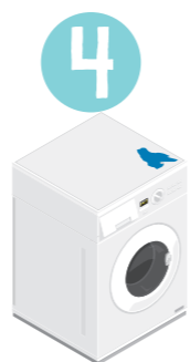
Torka av tvättmedel från tvättmaskinerna