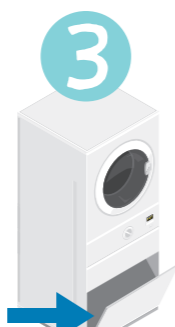
Rengör torktumlarens filter