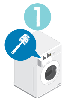
Rengör tvätt- och sköljmedelfacken med en borste

Även om torktumlaren är ett smidigt och snabbt sätt att få kläderna torra så är det flera material som inte mår bra av att torktumlas: akryl, viskos, ylle och lin är exempel på sådana material.