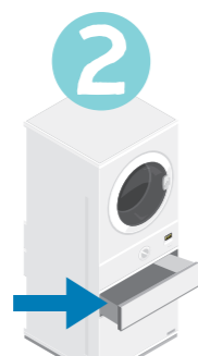
Rengör torktumlarens luddlåda