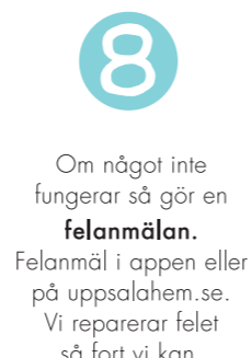
Om något inte fungerar så gör en felanmälan . Felanmäl i appen eller på uppsalahem.se. Vi reparerar felet så fort vi kan.